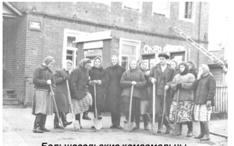
Большесельские комсомольцы. Сбор на субботник

Работников райкома приглашали в военкомат, проводить с